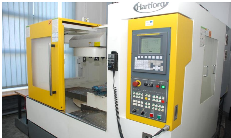
Centrum Obróbcze Hartford LG – 800 ze sterownikiem Fanuc AI100